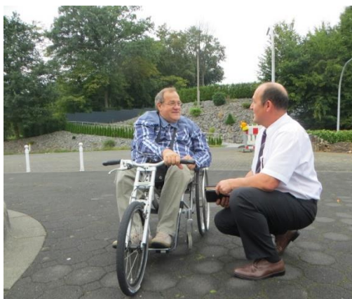
Unterhaltung aus verschiedenen Perspektiven

Увиденная картина тронула меня до глубины души. Мне стало дорого то, что приезжий проповедник Ф., нашёл время, подошёл к брату инвалиду, и говорил с ним не с